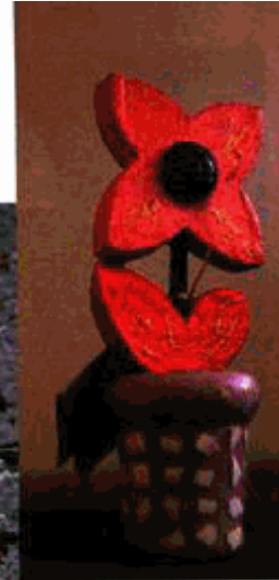
REABILITAÇÃO PELO TRABALHO Portadores de transtornos mentais em oficinas onde produzem objetos de madeira, trabalham em tear e fazem papel com sementes que germinam. A produção é vendida e o dinheiro dividido entre os pacientes